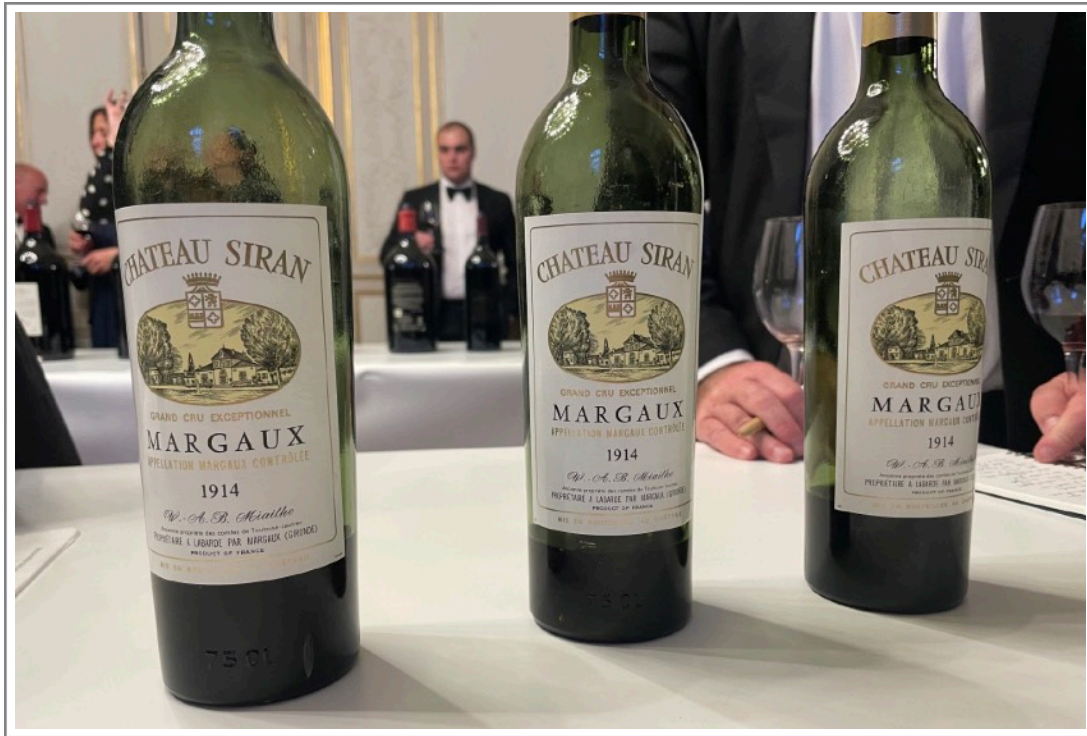
Tussen de 2023's door kregen we ook wel eens wat anders te drinken, zoals deze Siran 1914 bij het jaarlijkse Dîner de l'Académie, 23 april 2024

Wel bij de aanraders staan de wijnen die indruk op ons maakten, waar we blij van werden. Sommige wijnen zijn onderstreept. Dat is zo als we extra blij naar buiten kwamen. Alle wijnen in onderstaand lijstje zijn koopwaardig, maar: dit lijstje is niet compleet want we hebben niet alles geproefd. Wel veel. Heel veel.