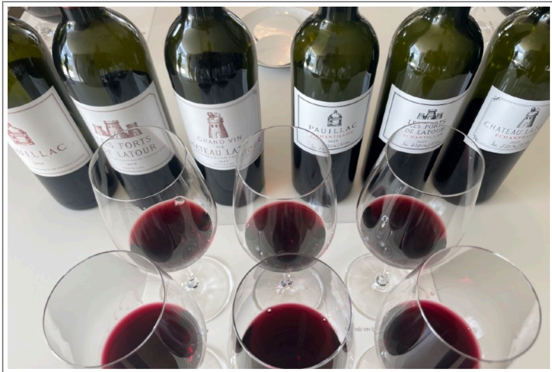
Latour, 22 april 2024

het noemen van ‘precisie’) de ‘fluwelen en perfect rijpe’ tannines, ook als je tanden er bij het proeven bijna uit vallen en je door de drogende werking moeite