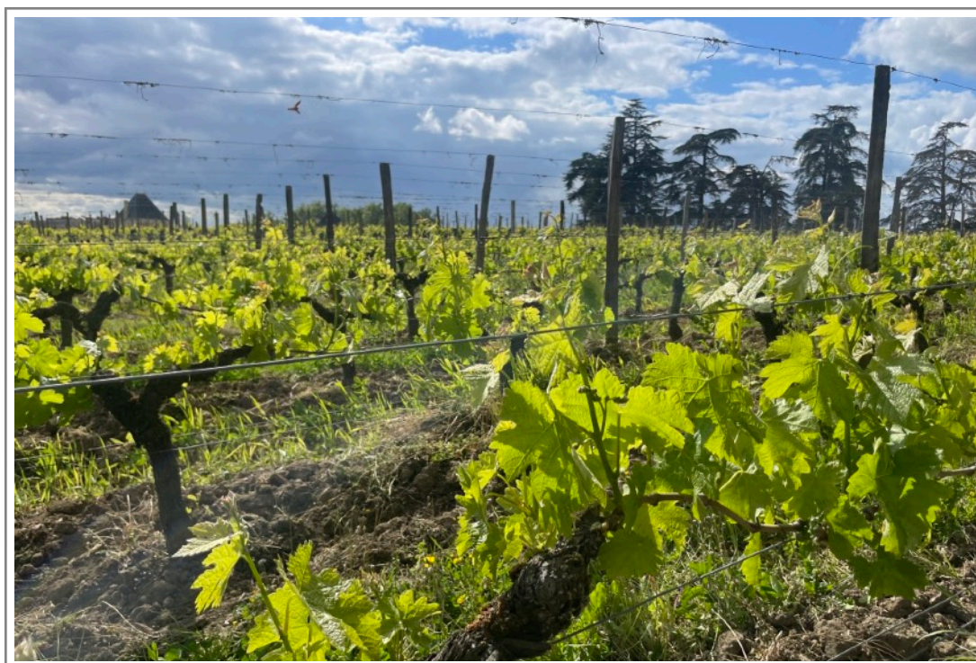
Rocheyron, Saint Christophe-des-Bardes, 24 april 2024, waar Mathieu Raveraud met Peter Sissack een briljante Saint Emilion maakt

020 - 422 3098 info@bolomey.nl bolomey.nl/bordeaux-2023