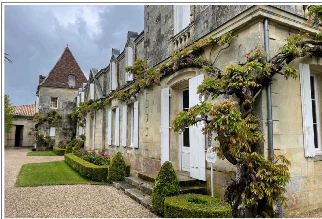
Vieux Château Certan, 25 april 2024

extractie. En vooral tijdig daarmee te stoppen. Niet iedereen is zo oplettend geweest.