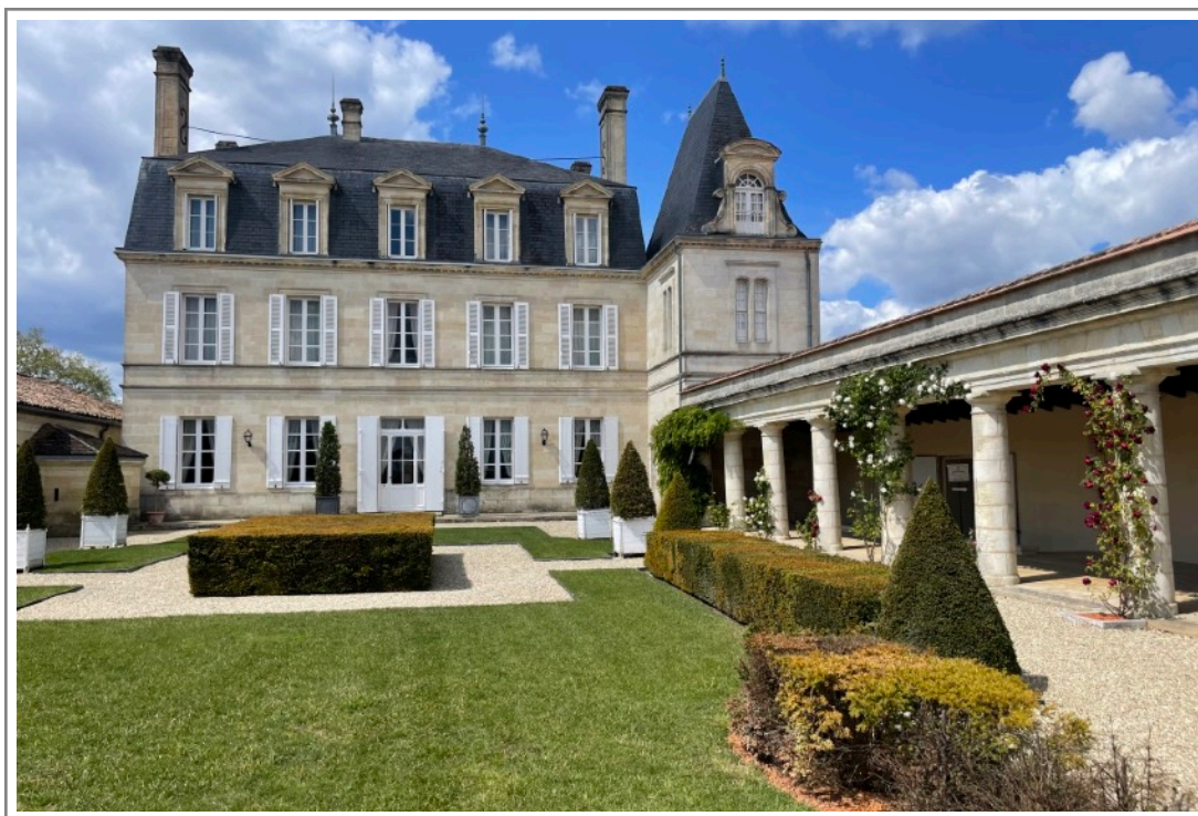
Grand Puy Lacoste, 23 april 2024

Enfin, tot 15 augustus was het iets warmer dan gemiddeld, droog, maar wel veel bewolking. De véraison kwam vroeg maar duurde lang, bijna een maand. In die