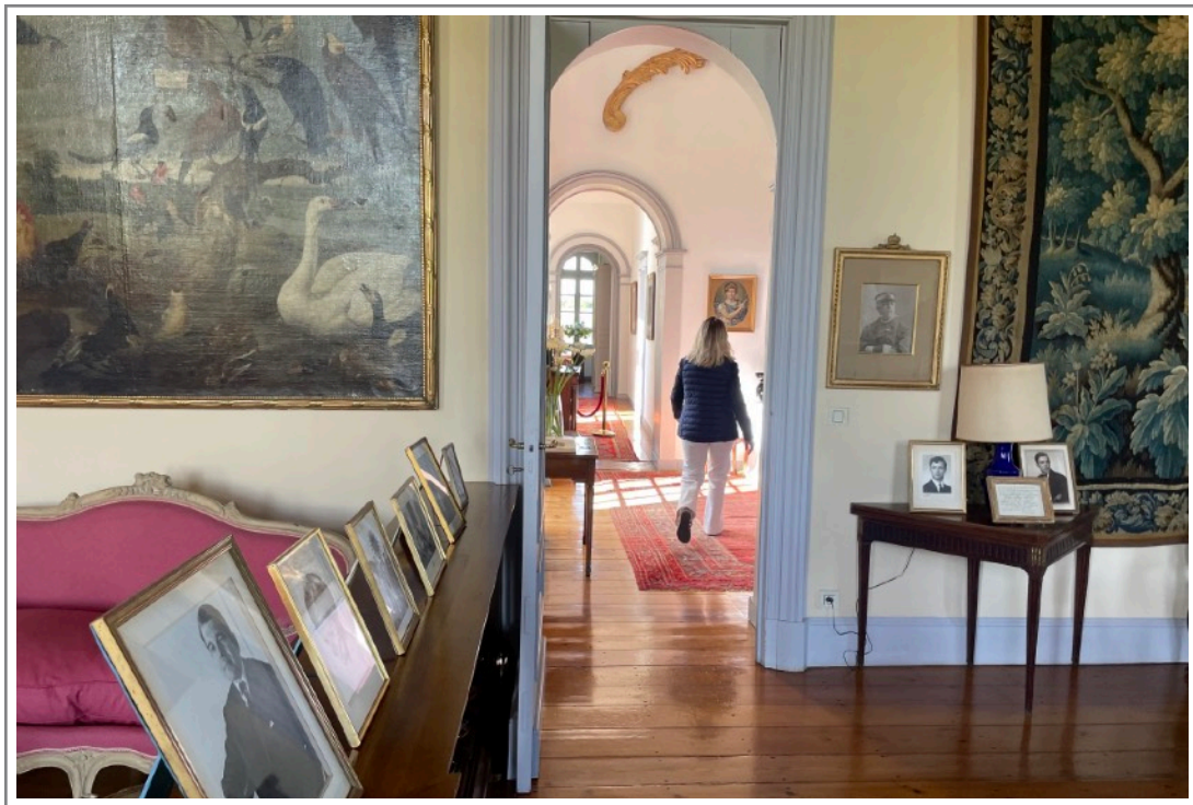
d'Issan, 22 april 2024

Mei was zonnig, warm en ook minder nat, het weer was gunstig voor de groei van de wijnstokken en voor de bloei, die snel en gelijkmatig verliep zonder narigheid van coulure of millerandage . Voor de wijngaarden die gespaard bleven